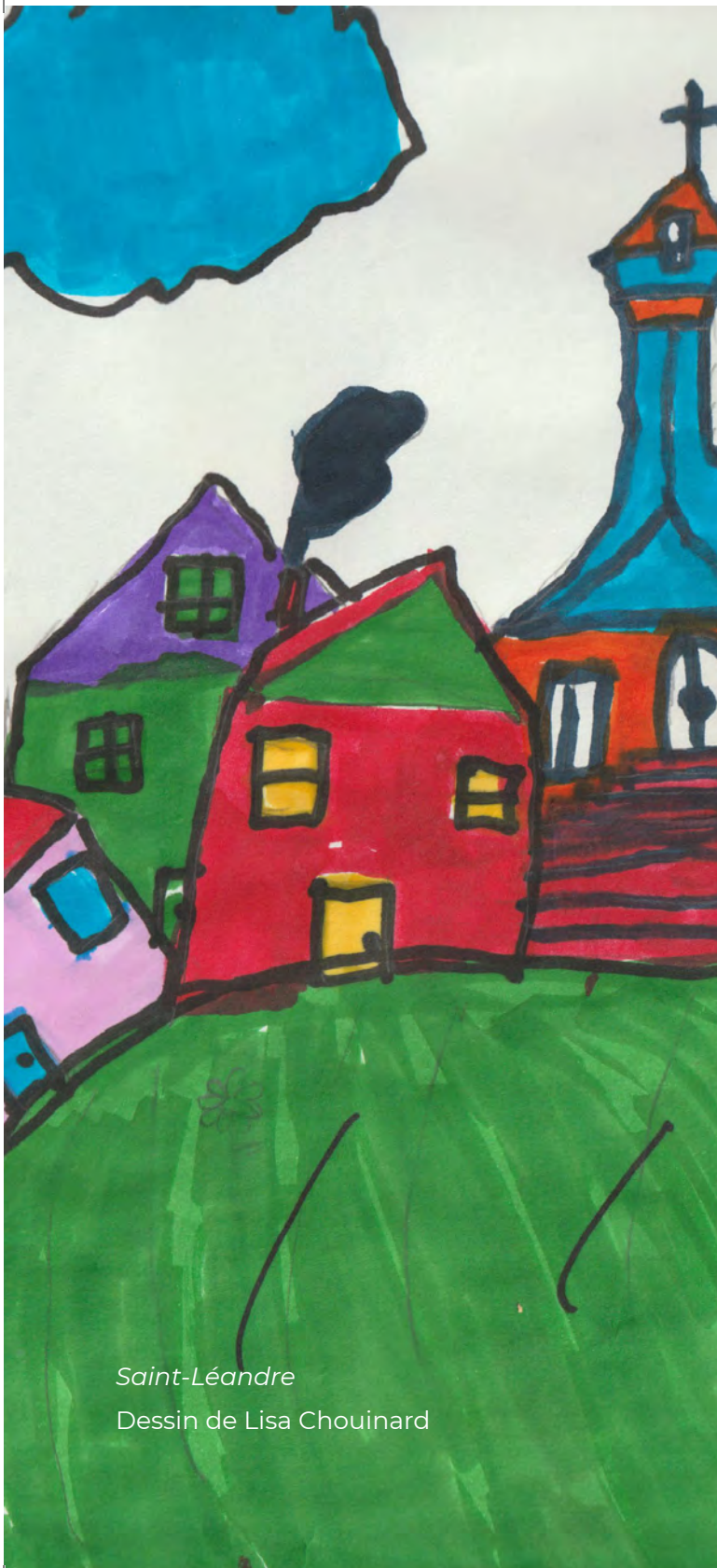
Saint-Léandre Dessin de Lisa Chouinard